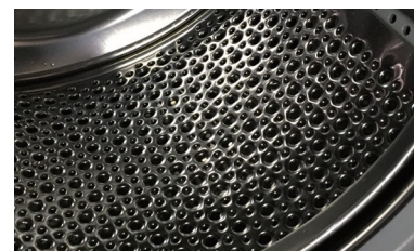
OBUTSU mini 専用ドラム