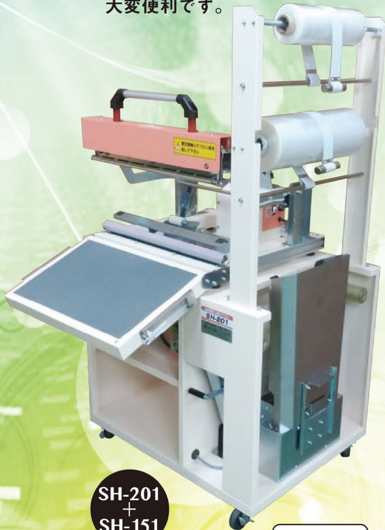
SH-201 + SH-151