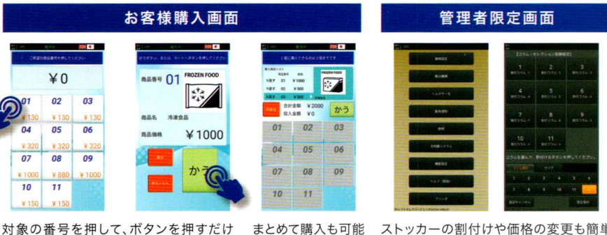
対象の番号を押して、ボタンを押すだけ まとめて購入も可能 ストッカーの割付けや価格の変更も簡単

販売時はお客様をサポートする購入画面として、設定を行う際は販売機の様々な設定を行える管理画面として使用することができます。専門知識がなくても簡単に操作可能です。